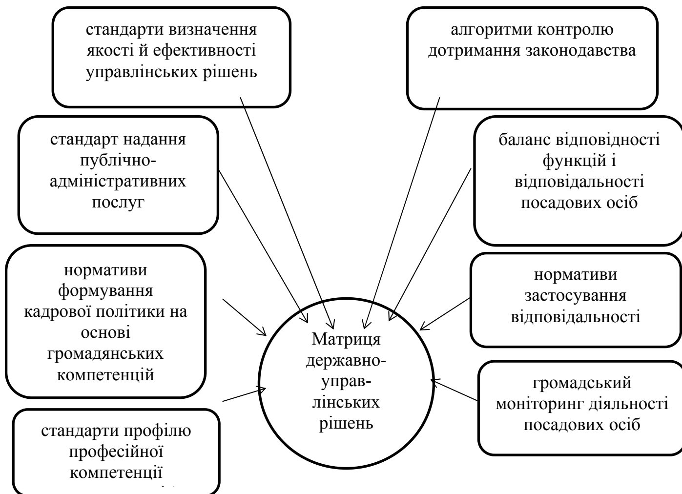
Рис. 1. Концепція матриці державно-управлінських рішень в умовах формування громадянського суспільства

також обсягами та якістю публічних послуг, які надаються суб'єктами публічного управління та адміністрування, що забезпечують поліпшення умов існування і життєдіяльності громадян.