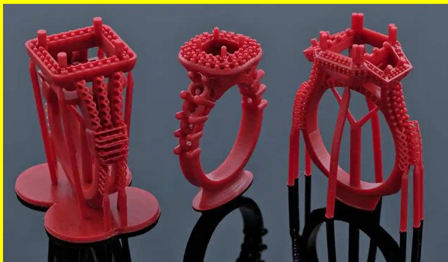
Воскові моделі жіночих каблучок